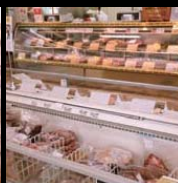
様々な部位の肉が揃う