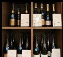
シャンパーニュはこだわりの作り手