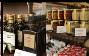
こだわりの調味料コーナー