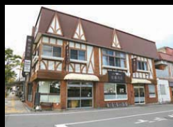
中軽井沢駅そば、店舗外観