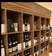
ブルゴーニュ中心のワインセレクト